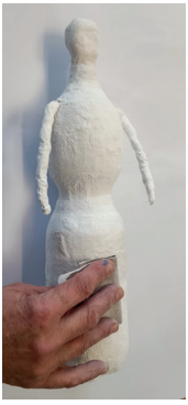
7 Levigare la superficie della figura con la carta vetrata.