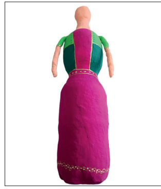
9 Colori l'intera figura con il colore desiderato e lasci asciugare la vernice. Per il colore verde scuro, aggiunga un po' di blu oltremare alla vernice verde permanente. CONSIGLIO! Per ottenere un colore uniforme, delimitare le aree da colorare con nastro adesivo rimovibile. Applichi il colore, lasci asciugare la vernice, tolga il nastro di mascheratura.