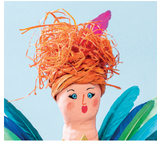
11 Disegni sul viso con pennarelli colorati, lasci asciugare la vernice. Per i capelli, tagli la rafia in piccoli pezzi, applichi una generosa quantità di colla sulla testa, prema i pezzi di rafia nella colla e lasci asciugare. Attorcigli due fili di rafia insieme. Avvolga questa corda intorno alla testa più volte. Incollì l'inizio e la fine del cordone. Fissi una piccola piuma nei capelli. CONSIGLIO! Al posto della colla universale si può utilizzare una pistola per colla. Utilizzare solo sotto supervisione!