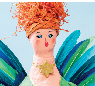
12 Disegni la collana con un pennarello color oro e applichi la stella.