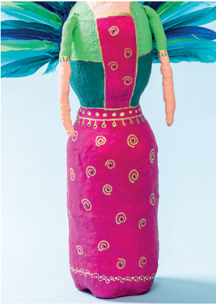
10 Disegni motivi e accenti con pennarelli colorati e lasci asciugare la vernice. Dipinga una stella di legno con un pennarello color oro.