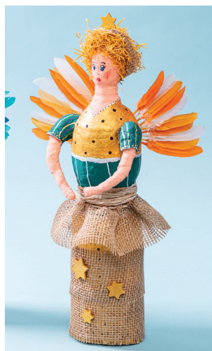
Engel - DORO