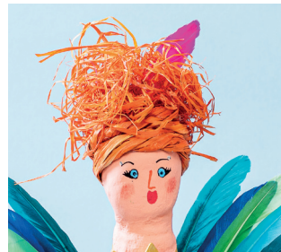
11. Gesicht mit Farbmarkern aufzeichnen, Farbauftrag trocknen lassen. Für die Haare, Bast in kleine Stücke schneiden, Klebstoff satt auf den Kopf auftragen, in den Klebstoff die Baststücke drücken und trocknen lassen. Zwei Baststränge miteinander verdrehen. Diese Kordel mehrmals um den Kopf legen. Anfang und Ende der Kordel ankleben. Eine kleine Feder in den Haaren fixieren. TIPP! Statt des Allesklebers kann eine Klebepistole benutzt werden. Die Benutzung nur unter Aufsicht!