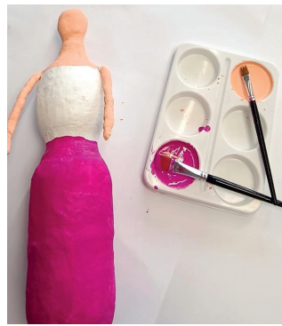
8. Nach dem Schleifen mit der Bemalung beginnen. Die Hautfarbe mit den Farben weiß (ca. 4 Teile von 5), rot (ca. 0,5 von 5) und gelb (ca. 0,5 von 5) mischen. Kopf und Arme bemalen, Farbauftrag trocknen lassen.