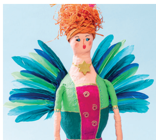
13. Für den Engelsflügel, Federn (ca. 13 Stück) zu einem Fächer aufeinander kleben, Klebeauftrag trocknen lassen. Einen weiteren Engelsflügel fertigen. Beide an der Rückseite der Figur ankleben. Klebeauftrag trocknen lassen.

Viel Spaß bei der Umsetzung wünscht das OPITEC-Kreativteam!