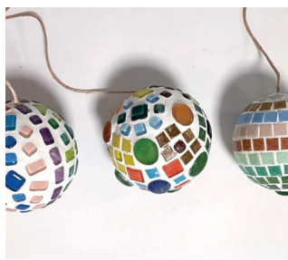
4. Polir les boules de mosaïque (voir instructions de base).